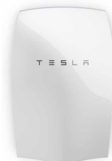
POWERWALL TESLA HOME BATTERY

Progettato per ridurre tensione e corrente lato CC durante le operazioni di installazione, manutenzione o durante l'intervento degli operatori anti incendio